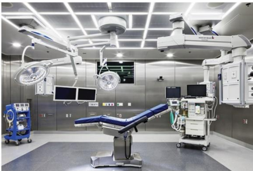
ورق استیل (Stainless steel)