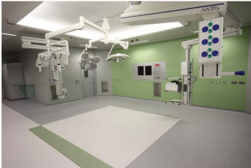
ورق گالوانیزه (Galvanized)